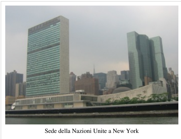
Sede della Nazioni Unite a New York

Il 14 agosto 1941 il Presidente degli Stati Uniti Franklin Delano Roosevelt ed il Primo Ministro britannico Winston Churchill in un incontro tenuto sulla nave da guerra britannica HMS Prince of Wales nell'Oceano Atlantico, firmarono la Carta Atlantica, nella quale stabilirono un insieme di principi di collaborazione internazionale per il mantenimento della pace e della sicurezza.