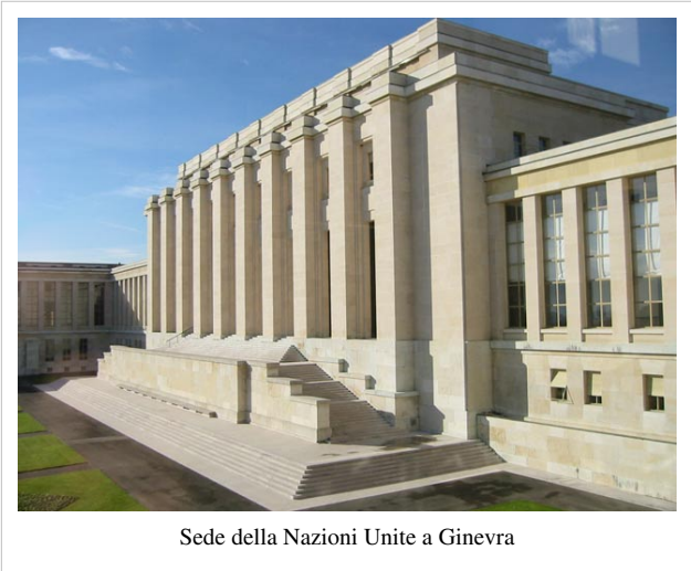
Sede della Nazioni Unite a Ginevra

Nel dicembre 1945 Senato e la Camera dei Rappresentanti con voto unanime richiesero che la sede delle Nazioni Unite fosse negli Stati Uniti. La richiesta fu accettata e la sede fu costruita a New York sulle rive dell'East River e su un terreno acquistato tramite una donazione di 8,5 milioni di dollari da John D. Rockefeller, Jr.. La sede aprì il 9 gennaio 1951.